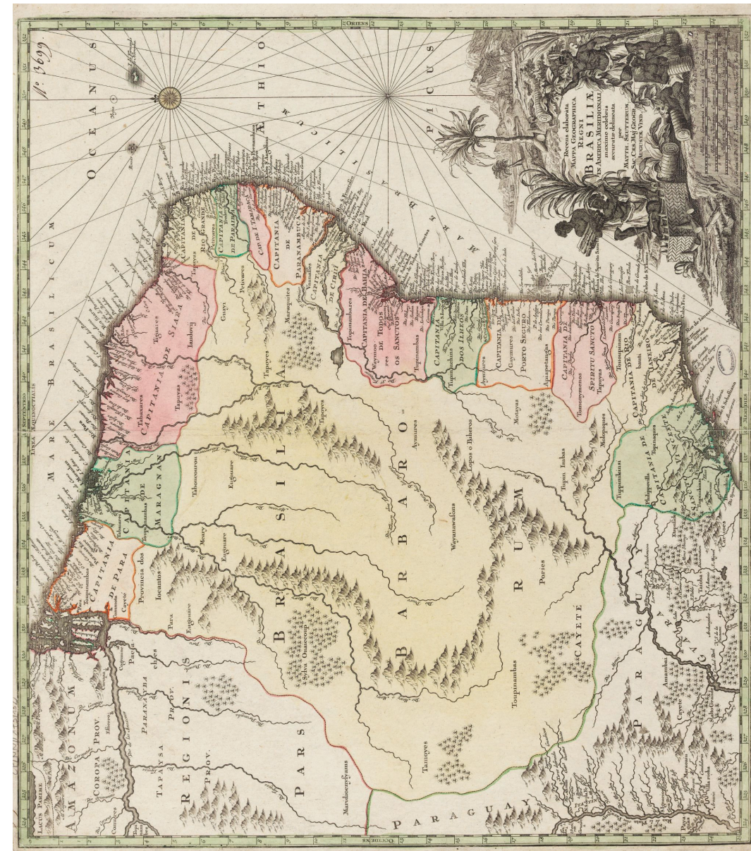
Recens elaborata mappa geographica Regni Brasiliae in America Meridionali , par Matthieu Seutter, géographe de l'Empereur à Augsbourg, 1 re moitié du XVIII e siècle (Paris, Archives nationales).