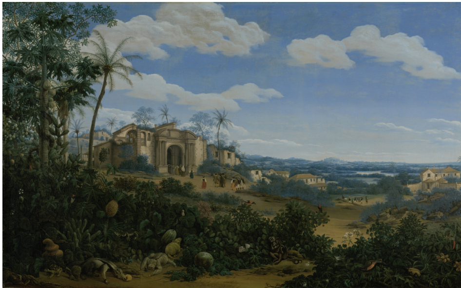
Vue de Olinda (Brésil) , par Frans Jansz Post, 1662 (Amsterdam, Rijksmuseum).

Les sources de la pratique autour du mariage permettent de faire surgir les stratégies et même parfois les voix des femmes esclaves ou affranchies dans la société coloniale brésilienne au tournant des XVII e et XVIII e siècles. Elles invitent à repenser la question de l'esclavage et de la diaspora africaine en terre brésilienne à partir du genre.