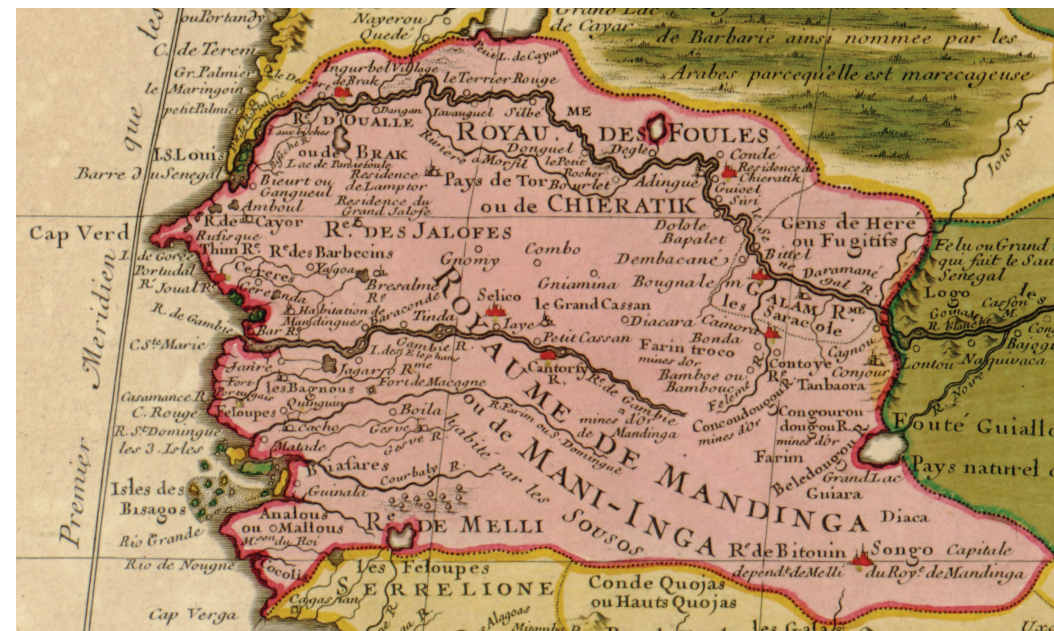
Carte de la Barbarie de la Nigritie et de La Guinée, par Guillaume Delisle, 1707 (Washington, Library of Congress).